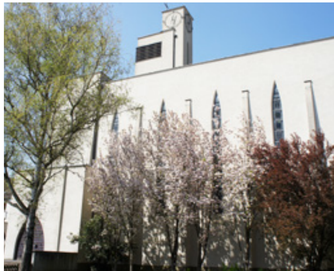
Ansicht der Rückseite der Kirche mit frühlinghaften Antlitz